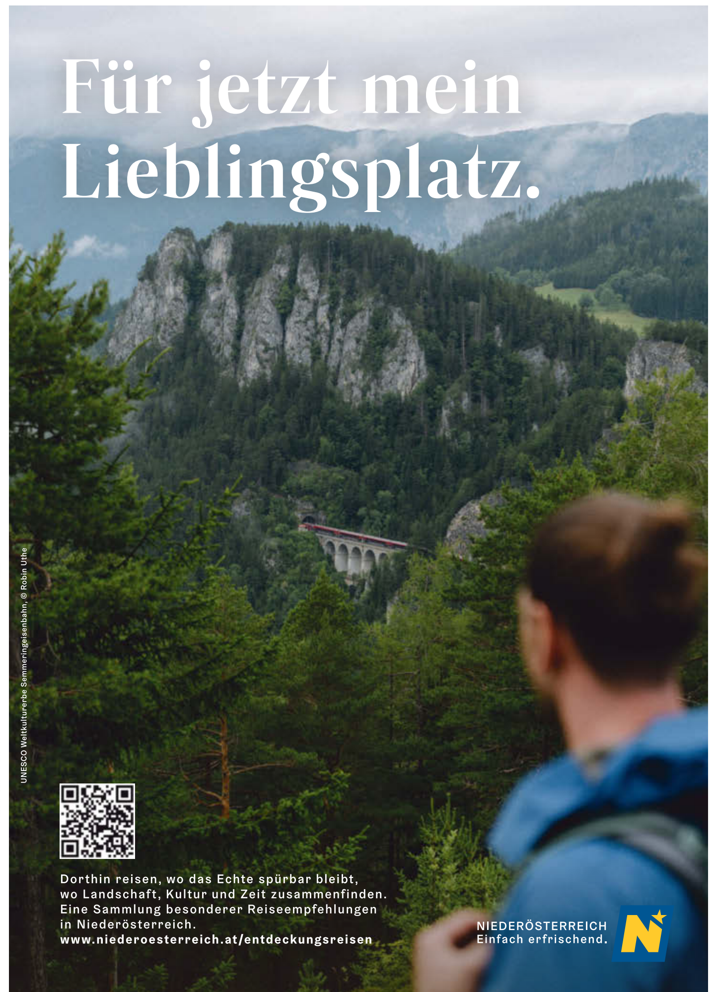
UNESCO Weltkulturerbe Sommeringseisenbahn.