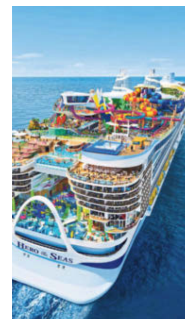
ROYAL CARIBBEAN INTERNATIONAL/DPA-TNN

schild ist der große, quietschbunte Rutschenpark an Bord. Er ist charakteristisch für die Schiffe von Royal Caribbean und wurde um zwei neue Rafting-Rutschen erweitert. Neu ist nach Angaben der Reederei auch ein Pool namens Coconut Cove (Kokosnuss-Bucht) mit Wasserliegen zum Relaxen und Bar-Service. Der nur für Erwachsene reservierte Bord-Bereich „The Hideaway“ bekommt einen Pool mehr, insgesamt hat das Schiff neun verschiedene Pools. Die „Hero of the Seas“ ist das vierte Schiff der Icon-Klasse, der größten Kreuzfahrtschiff-Kategorie weltweit. Zwei dieser Pötte sind schon auf den Meeren unterwegs: die „Icon of the Seas“ und die „Star of the Seas“. Im Juli 2026 soll die „Legend of the Seas“ folgen. Ein fünftes Schiff ist noch geplant. dpa