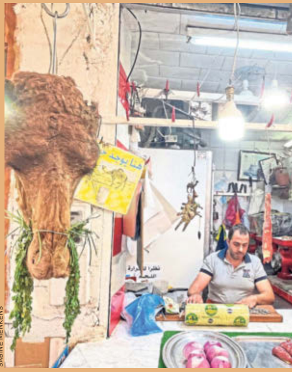
Für Unerschrockene: Kamelkopf beim Metzger in der Altstadt von Fes (l.); für Neugierige: Marokkanische Kochschule auf dem Dach des „Palais Amani“ (r.)

Die marokkanische Königsstadt betört Augen, Ohren, Nase – und dank der traditionellen Küche auch den Gaumen. Für manche Zutat ist allerdings ein robuster Magen von Vorteil