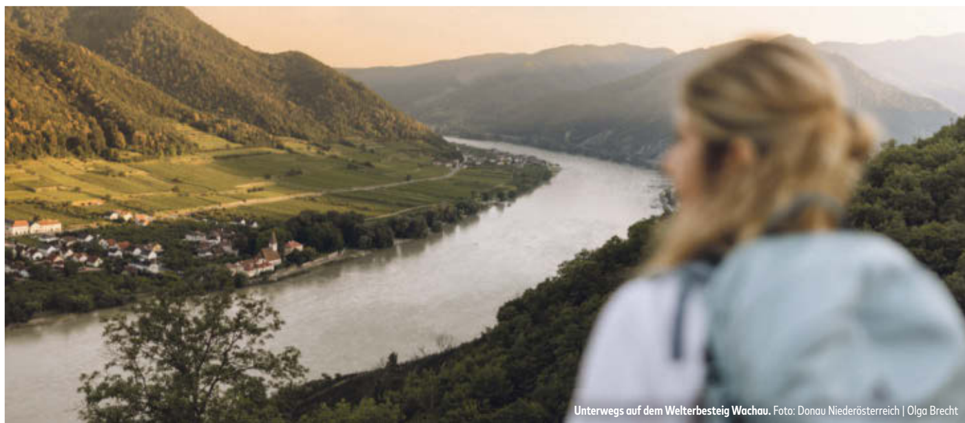
Unterwegs auf dem Welterbestieg Wachau.

Sechs fein kuratierte Entdeckungsreisen laden dazu ein, Niederösterreich aus neuen Perspektiven kennenzulernen – sorgfältig zusammengestellt, thematisch durchdacht und bewusst reduziert auf das Wesentliche.